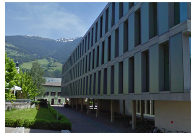
Brixen, Regensburger Allee 16 Raum 3.14