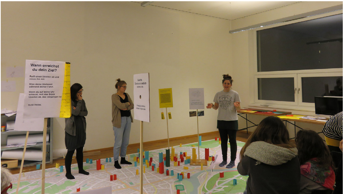
Figure 5. Studio courses led by Giorgio Camuffo, dedicated to the experimentation of the encounter of design and pedagogy, involving students along with designers

The project was also presented to the public during the Lunga notte della ricerca (LUNA) 2016.