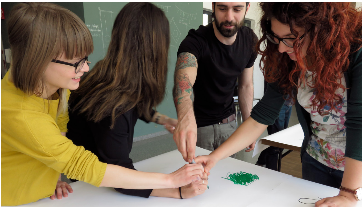
Figures 3, 4. Studio courses led by Giorgio Camuffo, dedicated to the experimentation of the encounter of design and pedagogy, involving students along with designers