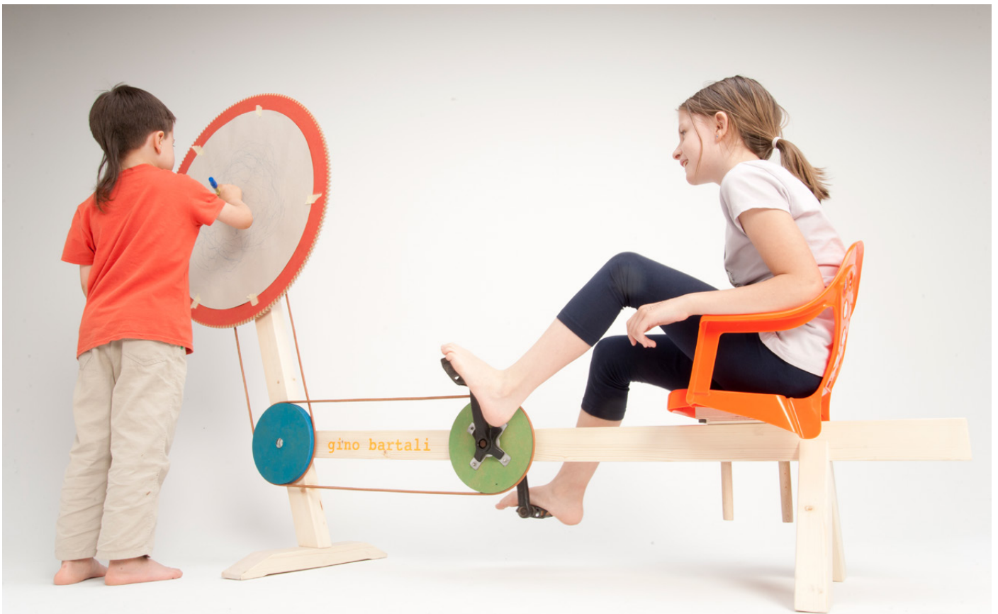
Figures 14, 15, 16. "Machines for drawing" workshop series