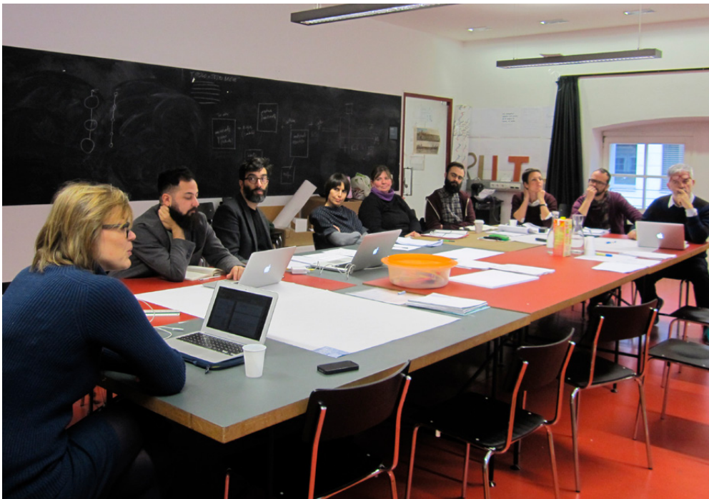
Figure1. Research group at work

In recent years, the educational system dominant in the North-Western part of the world has undergone close scrutiny and examination, being regarded as responsible of suppressing human natural capacities for creativity and innovation and of failing to meet the challenges of the new millennium. Reports and studies have called for the need to re-structure education to include much greater focus on developing creative, imaginative and thinking skills and to transform schools in a meeting place of co-construction where individual perspectives and languages are recognized and sustained. Furthermore, calls have also been made for developing a closer relationship between schools and other, more informal, learning contexts and organizations, such as museums, which are themselves engaged in enriching provision for learning and cultural education.