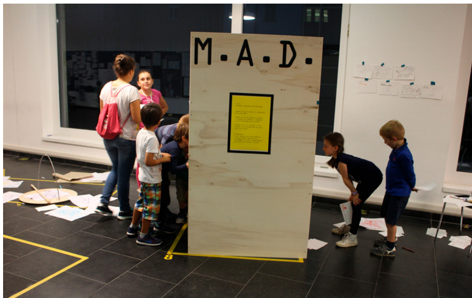
Figure 17. “Machines for drawing” workshop series

Il progetto ha incluso la organizzazione di (e la partecipazione a) numerose attività di disseminazione e di collaborazione con istituzioni culturali a Bolzano e in altre città. Fra questei una serie di attività pubbliche sotto il titolo “Come on Kids”, “Macchine per disegnare” e “Wunderfab”: laboratori e attività educative incentrate sulla comunicazione visiva e il design, ideati da studenti, ricercatori e designer e proposti al pubblico, in particolare bambini e ragazzi, in varie sedi culturali e negli spazi pubblici a Bolzano, Milano, Venezia, Rovereto, Mantova.