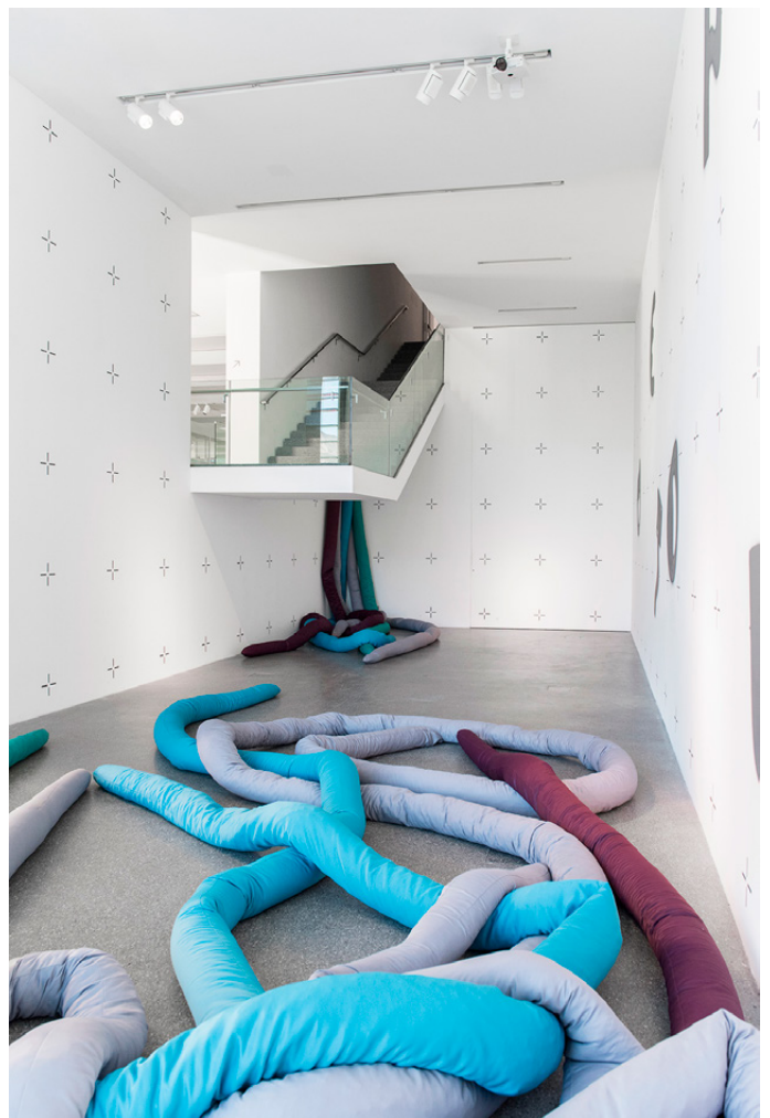
Figures 20, 21. "Octopus" a kids' space at Museion, Bolzano, conceived by students of the Interior and Exhibition Design studio course led by Roberto Gigliotti