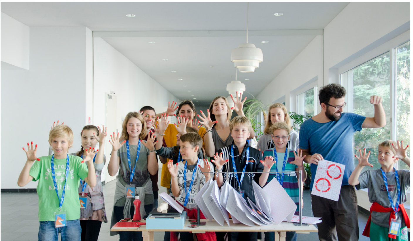
Figures 7, 8. "Come on Kids" workshops, held at various cultural venues and in public spaces in cities including Bolzano, Venice, Milan, Mantova and Rovereto.