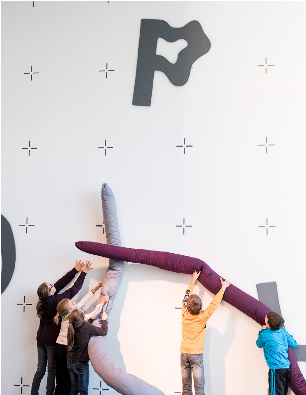
Figure 19. "Octopus" a kids' space at Museion, Bolzano, conceived by students of the Interior and Exhibition Design studio course led by Roberto Gigliotti