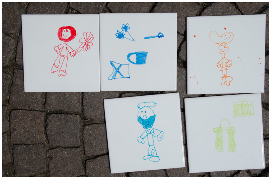
Figure 11. “Come on Kids” workshops, held at various cultural venues and in public spaces in cities including Bolzano, Venice, Milan, Mantova and Rovereto.

Negli anni recenti il sistema educativo dominante nella parte nord-occidentale del mondo sono stati sottoposti a rinnovata critica, e vari report e studi hanno evidenziato la necessità di riorganizzare l'apprendimento ponendo maggiore attenzione allo sviluppo delle abilità creative e immaginative, costruendo ambienti ed esperienze di apprendimento in cui le prospettive e i linguaggi individuali siano riconosciuti e sostenuti. Vari appelli sono stati avanzati anche per sviluppare più strette relazioni fra le scuole e altri contesti e istituzioni di apprendimento informale già impegnati nell'offerta culturale e educativa. Nel quadro delle sfide e dei cambiamenti attuali, il design può avere un ruolo cruciale per innovare le esperienze di apprendimento creativo a diversi livelli e scale. Questa direzione merita di essere esplorata e valutata attraverso attività di ricerca e sperimentazione multidisciplinari, a cavallo fra scienze della formazione e discipline del progetto.