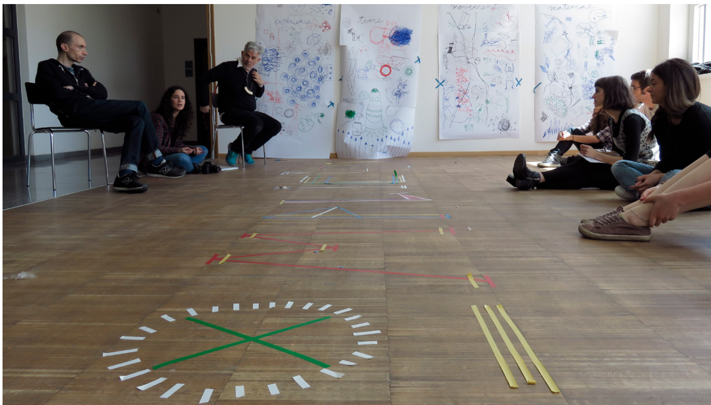
Figure 6. Studio courses led by Giorgio Camuffo, dedicated to the experimentation of the encounter of design and pedagogy, involving students along with designers

The “Come on Kids!” Initiative (already launched by Giorgio Camuffo in 2012), developed in the framework of the EDDDES project, was awarded in 2016 as an exemplary project of the Free University of Bolzano’s “Third Mission”.