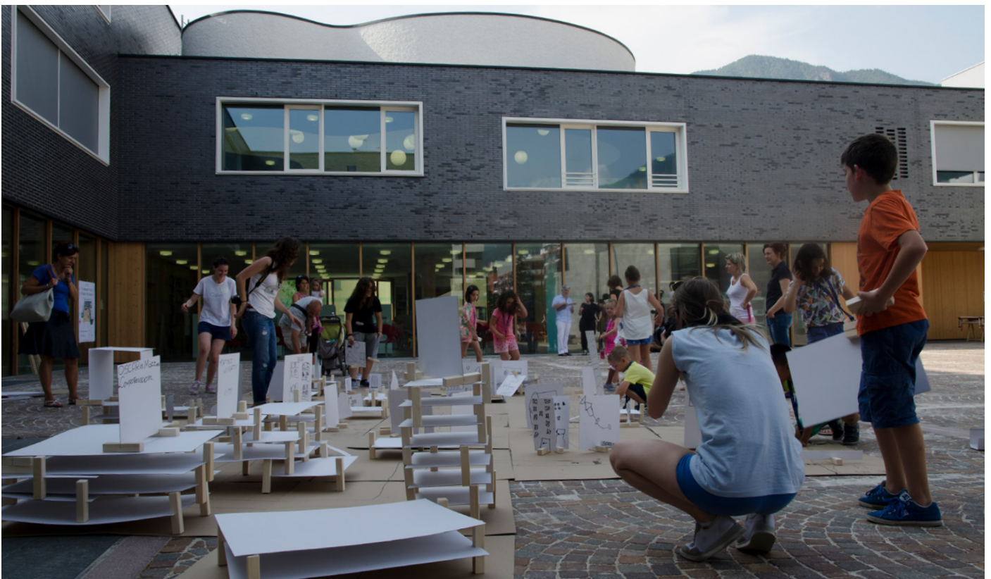
Figures 12, 13. "Come on Kids" workshops, held at various cultural venues and in public spaces in cities including Bolzano, Venice, Milan, Mantova and Rovereto.