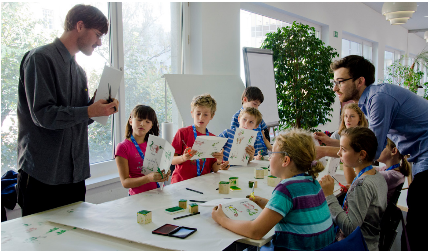
Figures 9, 10. "Come on Kids" workshops, held at various cultural venues and in public spaces in cities including Bolzano, Venice, Milan, Mantova and Rovereto.